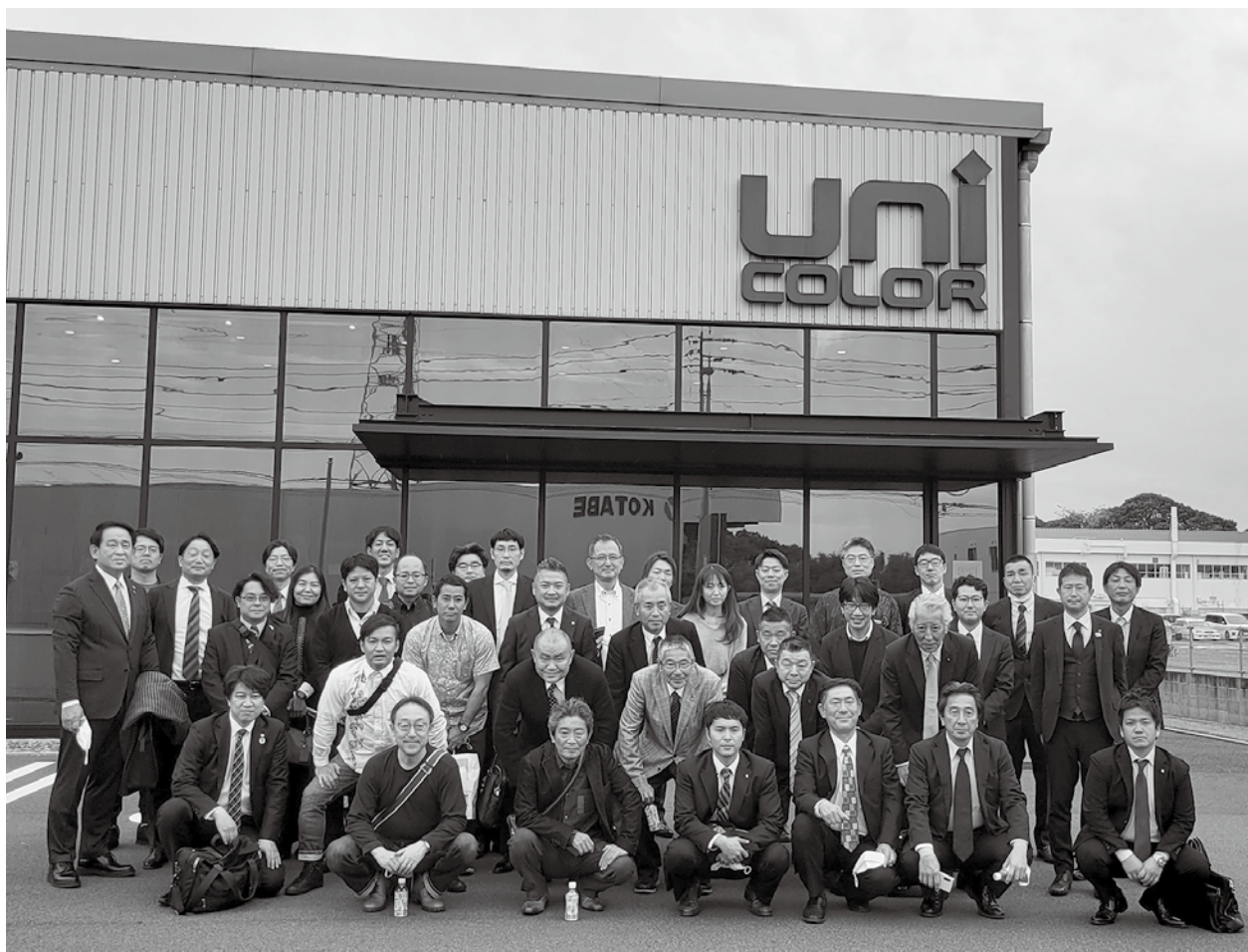
「九州・沖縄青年印刷人鹿児島大会」協業組合ユニカラー（鹿児島市）工場見学