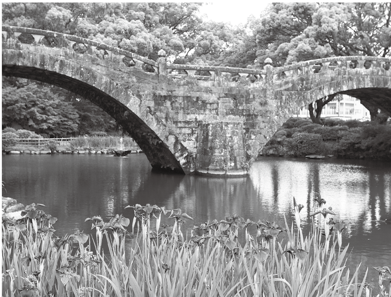
諫早公園（眼鏡橋と諫早菖蒲）