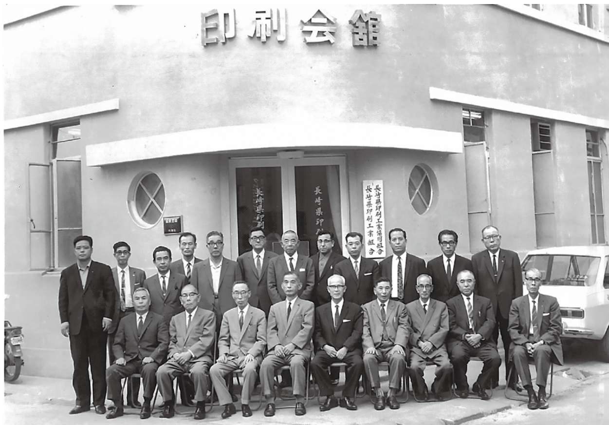
印刷会館 (撮影日不明)