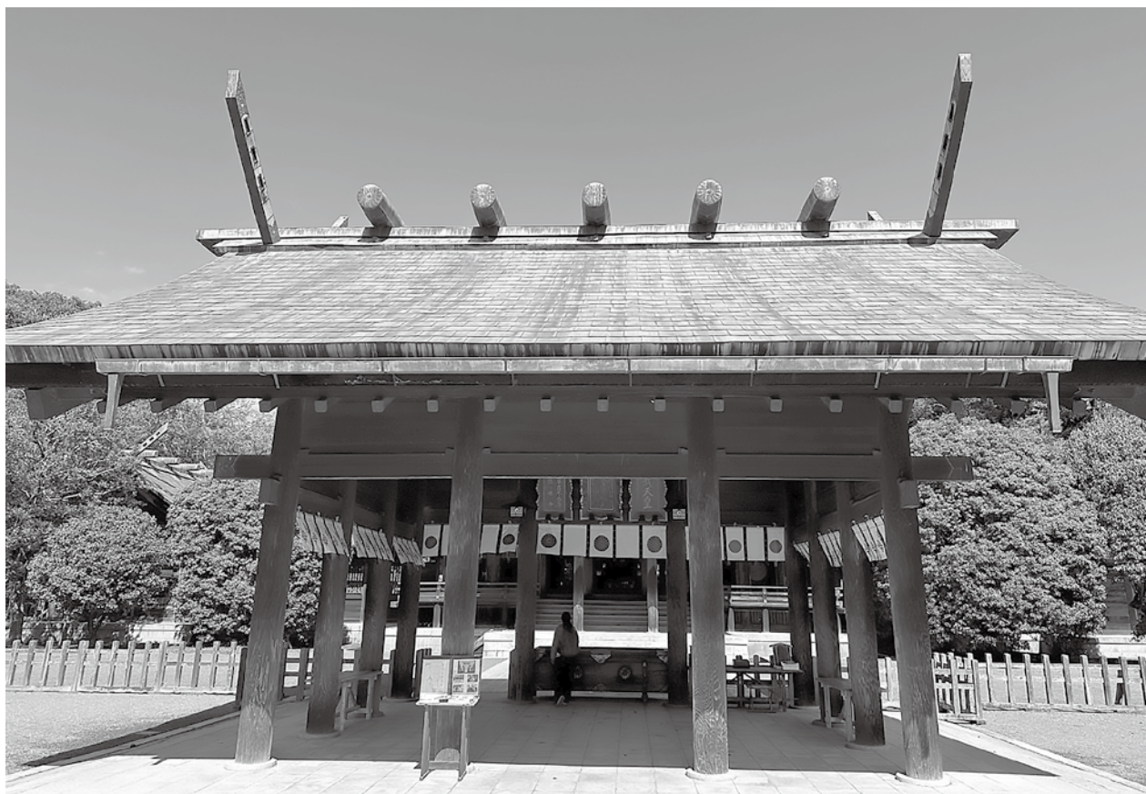
「宮崎神宮」(宮崎市神宮)